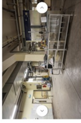
Vue intérieure du bâtiment avant transformation

L'ancienne façade latérale sera restaurée.