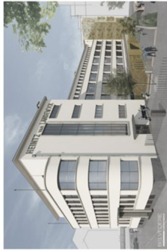
Le bâtiment Landewyck qui date de 1937 va retrouver une nouvelle jeunesse. (Illustration : Belvedere Architecture)