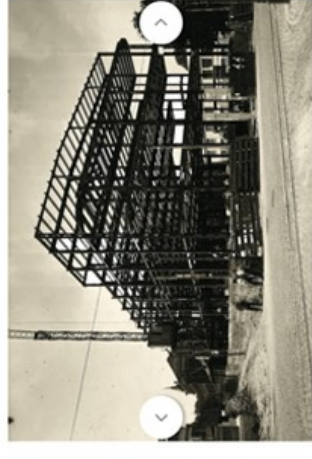
L'immeuble est en fait une construction à ossature métallique.

que c'était un bâtiment construit pour durer. De plus, nous avons la chance d'avoir encore accès aux plans historiques, ce qui nous permet de bien comprendre le bâti et son état original. C'est vraiment passionnant à étudier».