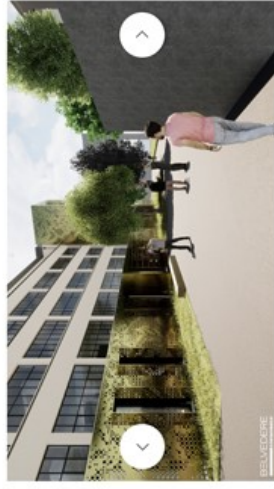
Le niveau inférieur par rapport à la rue sera aménagé en rez-de-jardin pour la nouvelle entrée. (Illustration : Belvedere Architecture)

C'est Belvedere architecture qui a reçu la mission architecturale de ce projet. Le reste de l'équipe est composé par HLG Ingénieurs-Conseils (ingénieur structure), Enerventis (ingénieur techniques), Solutec (entreprise générale), Areal Landscape Architecture (aménagement extérieur).